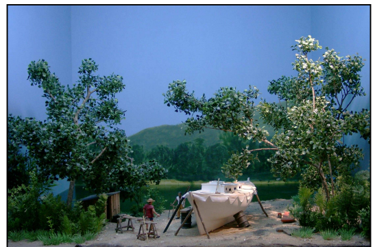
Diorama : Construction de Marie-Thérèse II

1958 : les poches pleines à nouveau, Moitessier reprend la route pour finalement connaître un nouveau naufrage aux Antilles. Il abandonne son bateau échoué sur une plage, et rejoint la France comme matelot sur un pétrolier.